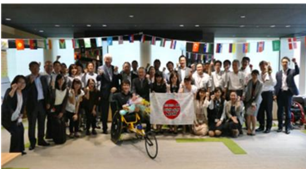
世界パラ陸上競技選手権大会（ロンドン）壮行会（今年7月）

また、障がい者およびパラスポーツに関する知見を広くするため、社員向け講演会の実施や、大会ボランティアの参加を促すなど、積極的に支援活動に取り組んでいます。