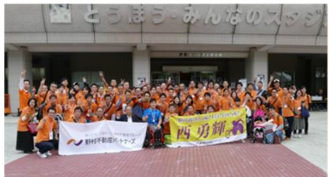
ジャパンパラ陸上競技大会（福島）（今年9月）