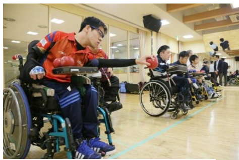
田端店での「ボッチャ」練習会