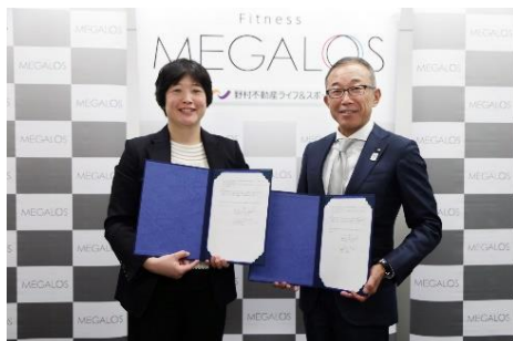
左から東京ボッチャ協会高山会長、当社大橋代表取締役社長

川崎市と連携を図り、パラアスリートの練習環境を整備することで、川崎市における障害者スポーツの普及を促進