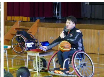
小学校での道徳授業講座（今年9月）