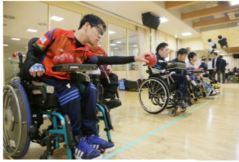
田端店での「ボッチャ」練習会