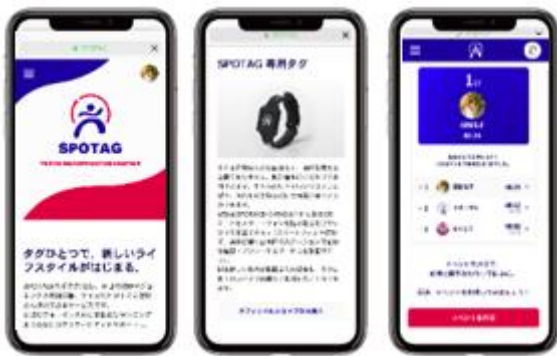
SPOTAG ウェブアプリイメージ

詳細情報： https://spotag.com/ または、 https://www.sportslegacy.jp/projects