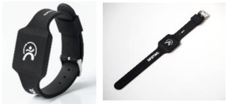
SPOTAG リストバンドイメージ