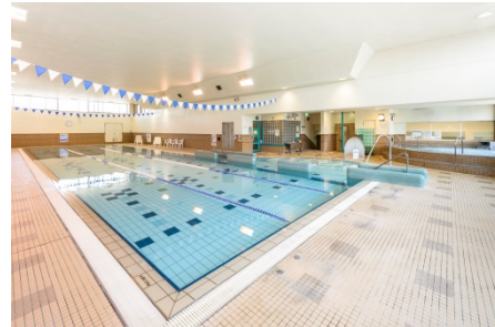
協定の対象となったプール