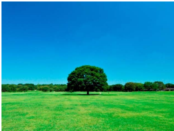
※国営昭和記念公園

※「パークフィットネス」・・・公園で誰もが気軽に参加でき、楽しむことのできるスポーツプログラム