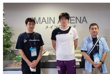
2022年9月「2022 ジャパンパラ水泳競技大会」