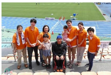
2022年7月「NAGASE カップ パラ陸上競技大会」