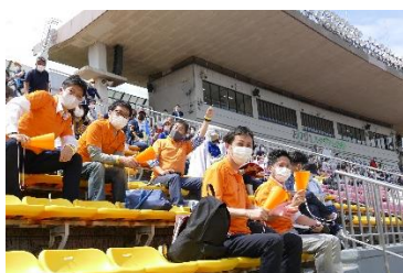
2022年5月「2022 ジャパンパラ陸上競技大会」

人事部・経営企画部のメンバーが中心となり両選手をバックアップする応援部隊を結成。練習場の確保やユニホーム製作などの支援のほか、試合の結果や近況を社内報で周知しています。また、野村不動産グループ全体で応援団を結成し大会応援に駆け付けるなどのサポートの実施や大会ボランティア参加を促す等、引き続き、障がい者およびパラスポーツに関する知見を広げるため、積極的に支援活動に取り組んでまいります。